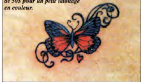
Il faut compter un minimum de 50$ pour un petit tatouage en couleur.

il s'agit de faire un contour (comme par exemple une fleur), coûte 20$. Pour une même taille, une coccinelle (couleurs rouge et noire) coûtera 50$. Les prix des tatous à Skin Deep commencent à partir de 50$. «Un travail bon marché n'est jamais bon et un bon travail n'est jamais bon marché.» Il vaut mieux faire un tatouage une bonne fois pour toutes même si des techniques pour couvrir un tatouage mal fait existent. «L'amertume d'un tatouage de mauvaise qualité reste longtemps après que la douceur du prix bon marché est oubliée», comme le dit un proverbe chinois. Certaines parties (les fesses, à côté des aisselles ou sur des vergetures) plus difficiles à travailler verront leurs prix augmenter. Ainsi, si la mère et la fille décident de faire le même tatouage avec les mêmes couleurs et la même taille mais l'une veut le faire sur son épaule alors que l'autre décide d'un tatouage sur une fesse, il ne faut pas s'étonner car le second va coûter plus cher. La question demeure: «Laquelle des deux s'est fait tatouer sur les fesses?» A vous de deviner... ■ RAMELIA CHAMICHIAN