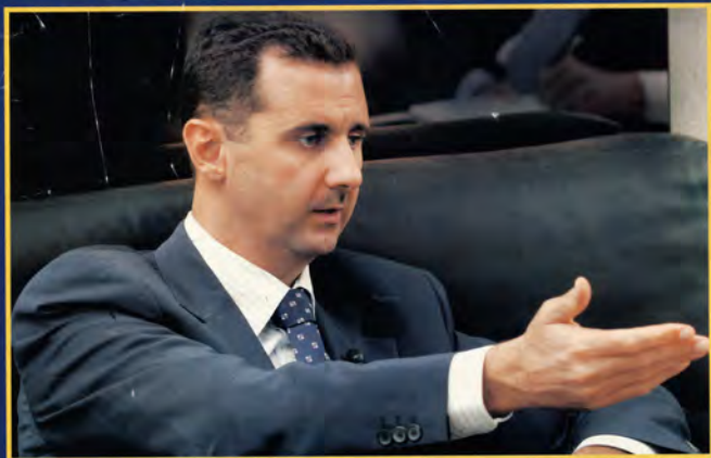
MAHER EL-ASSAD IL CHAPEAUTE L'ARMÉE